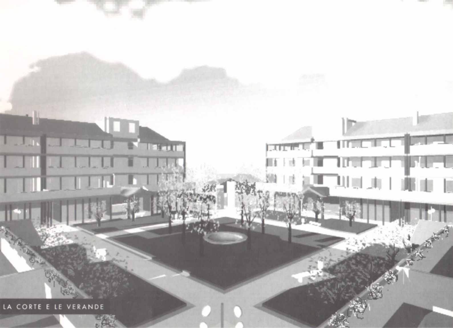
LA CORTE E LE VERANDE